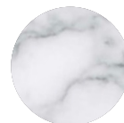
marmo bianco di Carrara